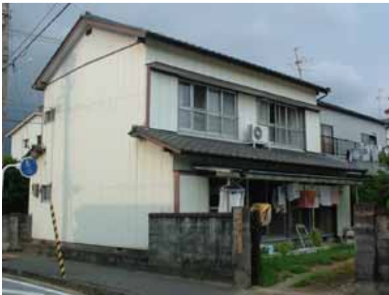
デイサービス（NPO法人デイサービスまる）