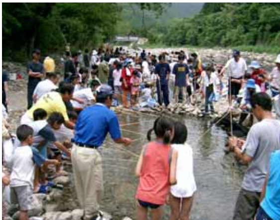
[ 清流祭り (アメゴ釣り) ]