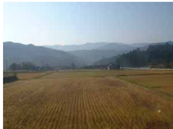
[ 田園風景 ]