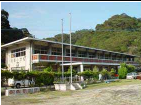
使用予定の廃校施設