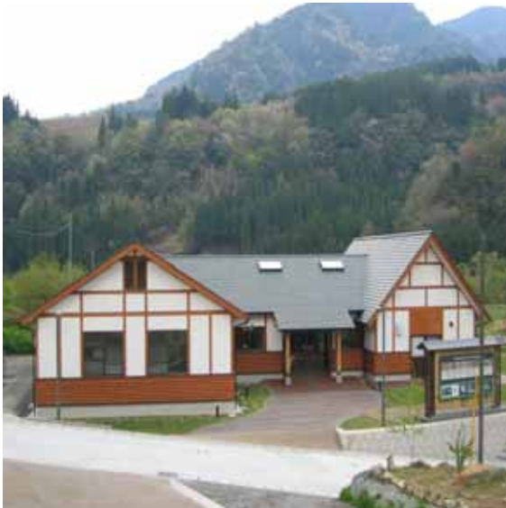
体験交流施設「 おだまき 緒環」