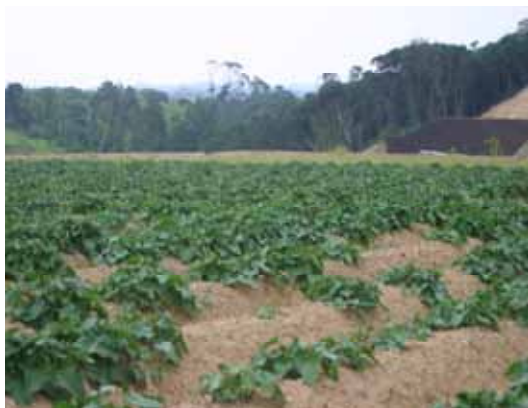
特区参入候補地における焼耐用さつまいも (コガネセンガン)の試験栽培

適用される規制の特例措置： ・農地貸付方式による株式会社等の農業経営への参入の容認