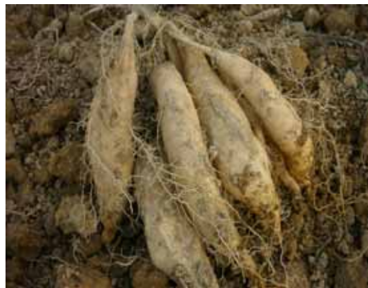
コガネセンガン(種芋用) 種芋からの育苗技術を普及啓発し、生産コストの低減と安定した生産をめざす。