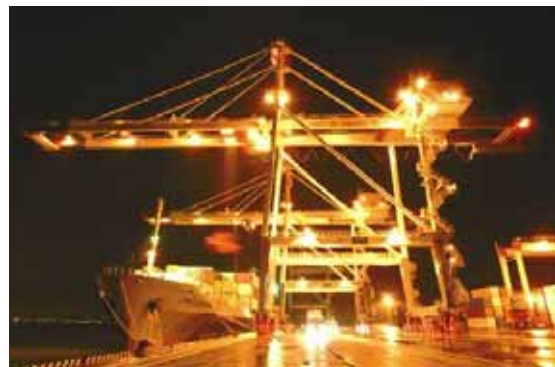
アイランドシティ国際コンテナターミナル