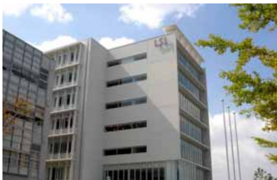
福岡システムLSI総合開発センター