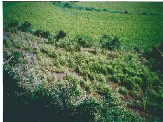
【被害にあった水田の状況】