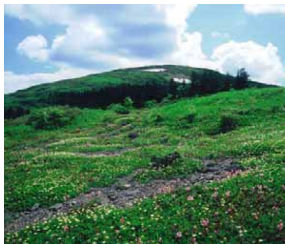
森吉山県立自然公園