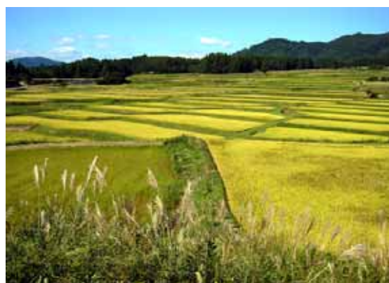
【田園風景・明光寺の棚田】 農業の振興により、農村の環境保全と、新たな起業化を目指す。