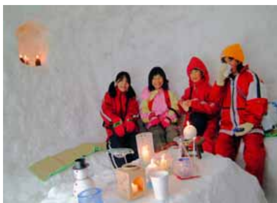
【雪まつり・子供達がかまくらの中で遊ぶ】 地域資源を活用し、雪国らしいもてなしも心で交流人口の拡大を目指す。