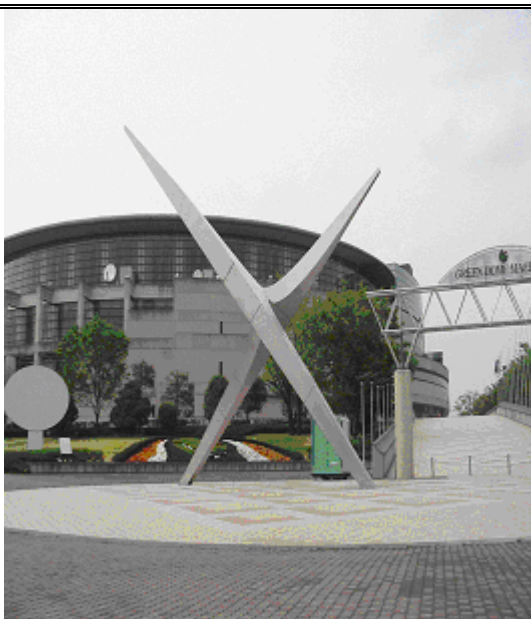
グリーンドーム前橋外観