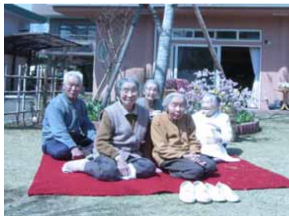
サテライト居住施設での地域交流のイメージ