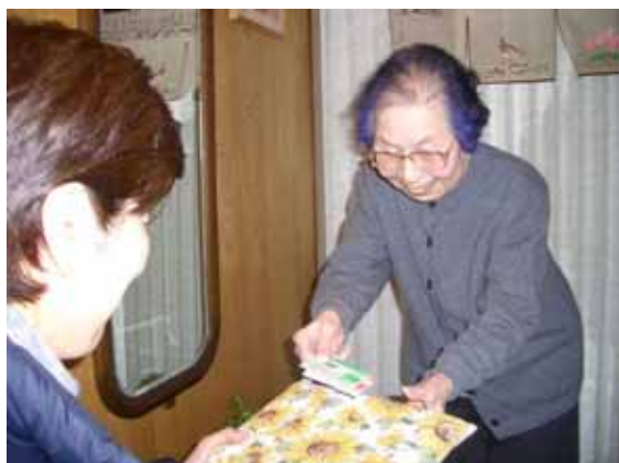
地域通貨でひろがる「地域のつながり」(吹田市「いっぽ」)