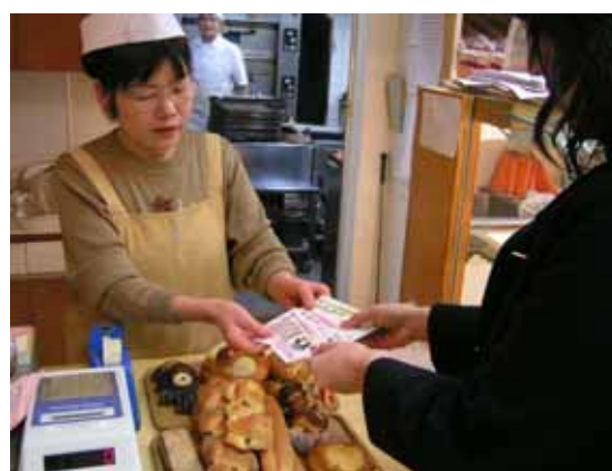
地元の商店街でお買い物(寝屋川市「げんき」)