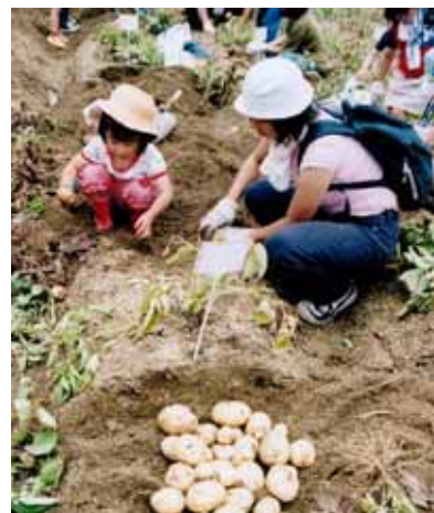
市民農園で農作業