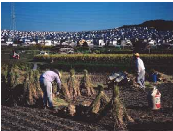
都市住民も農業参画