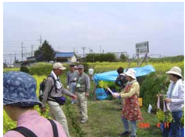
菜花を活用した都市農村交流イベントの様子