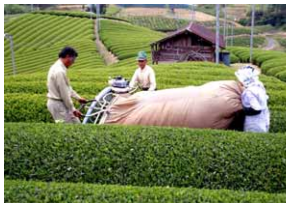
大淀町の特産品：茶