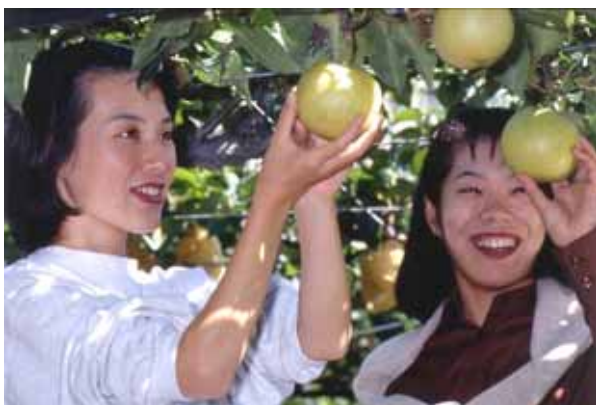
大淀町の特産品：ナシ