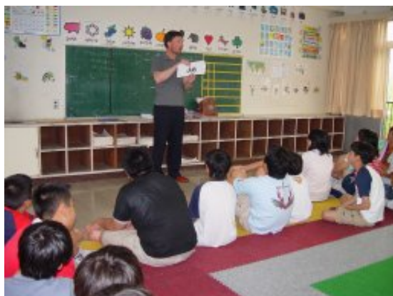
A L Tによる英語の授業