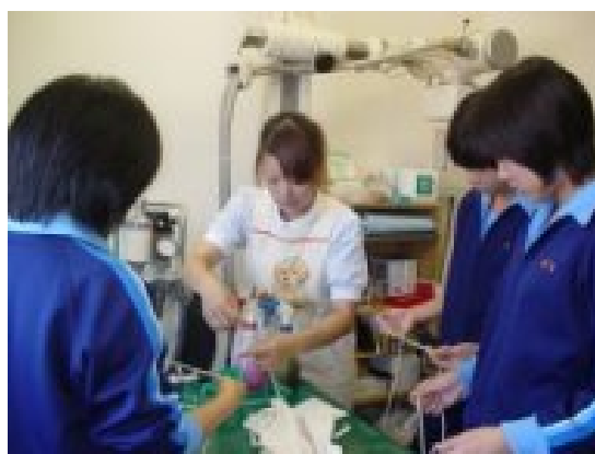
中学校の職場体験