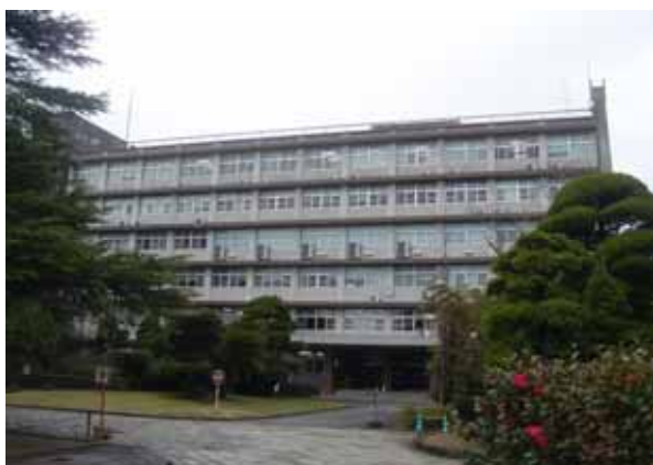
長崎大学経済学部