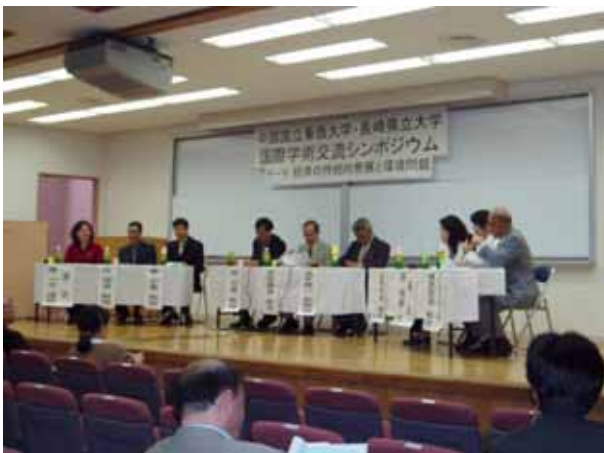
*中国華僑大学・長崎県立大学 / 国際学術交流シンポジウム

適用される規制の特例措置： ・外国人研究者の受入れ促進 ・外国人の入国、在留申請の優先処理