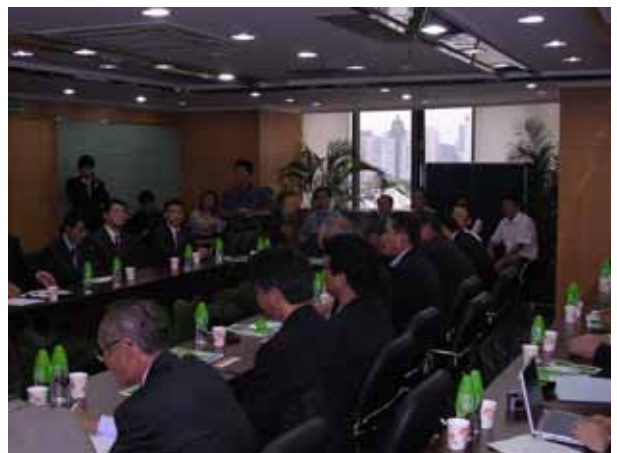
*企業交流セミナー（中国廈門市にて）