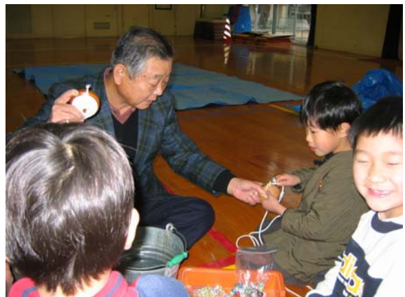
地域の達人 ゲストティーチャーに学ぶ