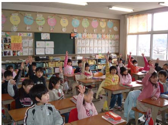
少人数学級で活力あるクラス