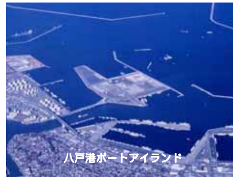
八戸港ポートアイランド