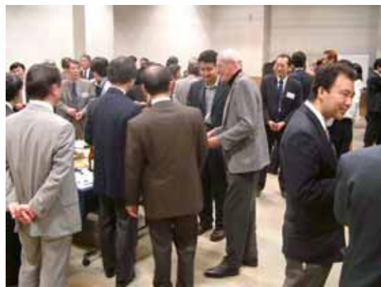
新横浜 IT クラスター交流会の様子 http://www.shin-yokohama.jp