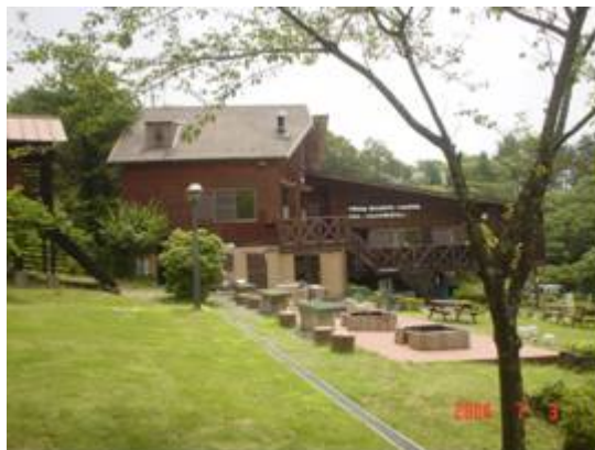
青山高原にある自然体験施設