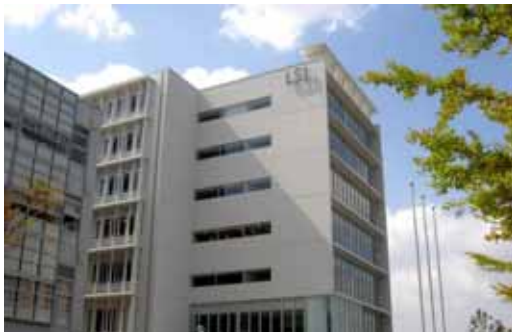
福岡システムLS総合開発センター