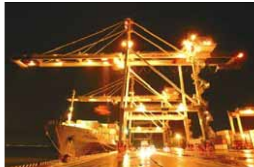
アイランドシティ国際コンテナターミナル