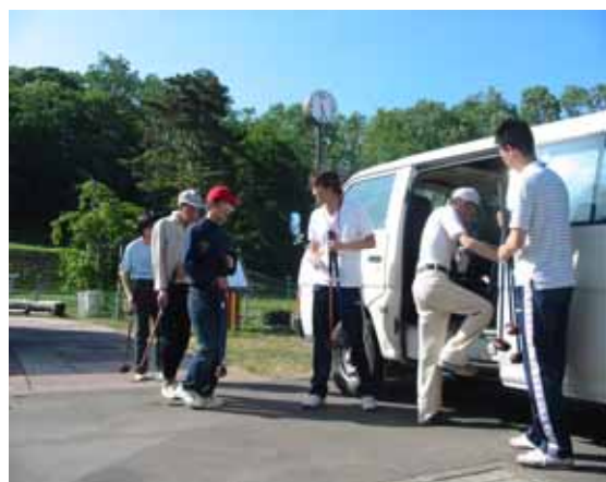
《知的障害者へのレク支援》