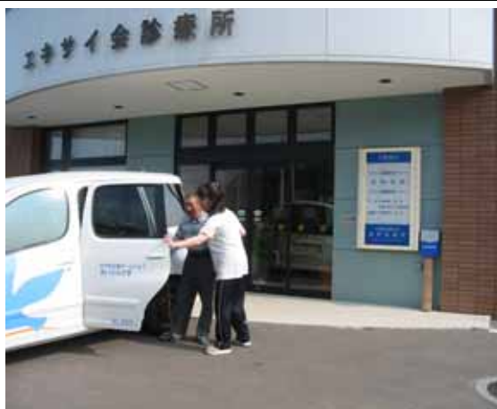
《ホームヘルパーによる通院の援助》