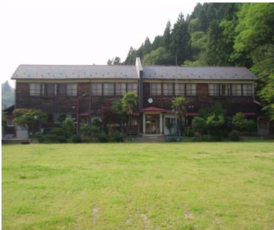
グリーン・ツーリズム体験施設＜さんさん館＞