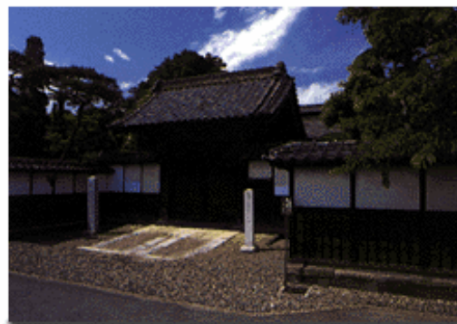
校地となる渋沢栄一翁生誕の地