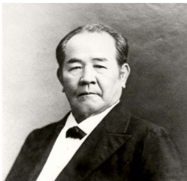
近代日本経済の父 渋沢栄一翁