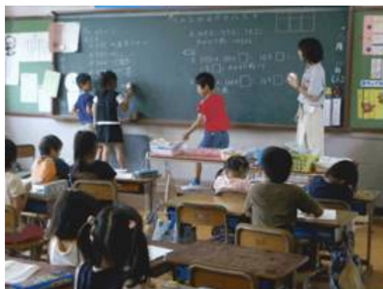
小学校低学年の授業風景（算数）