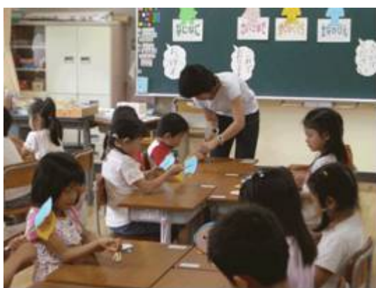
小学校低学年の授業風景（国語）