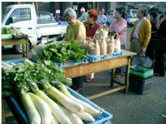
にぎわう朝市の様子