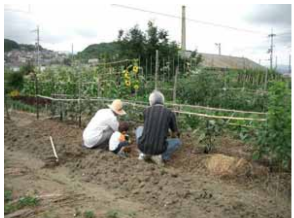
兼業農家が守る農地