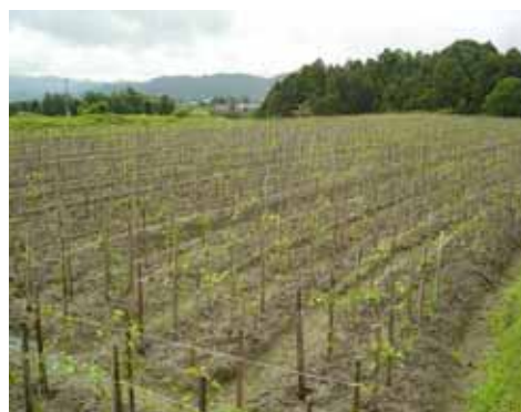
御所市の特産品栽培（ヤマノイモ）