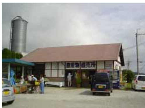
地場野菜などを販売する農産物直売所