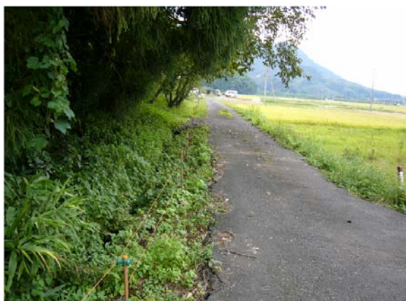
電気柵による被害防止対策