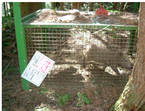
わな（箱ワナ）による捕獲