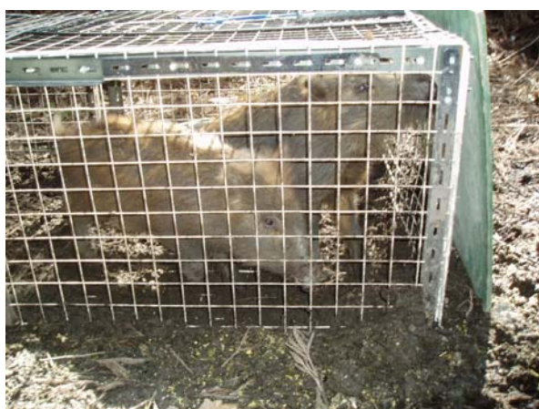
箱わなで捕獲されたイノシシ ( 邑智郡邑南町 )