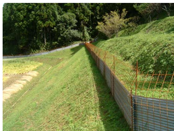
捕獲と併せ被害防止施設で被害軽減を図る ( 益田市美都町 )