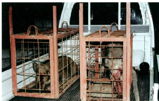
【捕獲されたイノシシ】