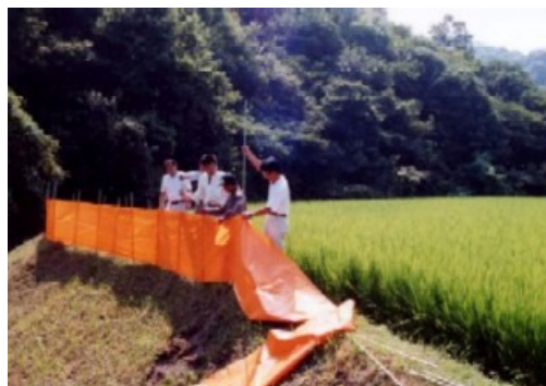
【イノシシ防護柵の設置作業】