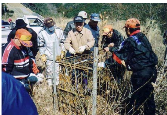
狩猟免許初心者に対する捕獲技術講習会