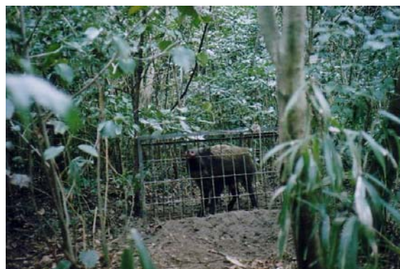
捕獲されたイノシシ