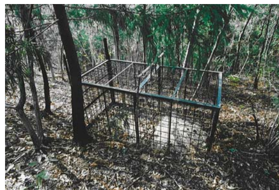
箱わな（イノシシ捕獲用）