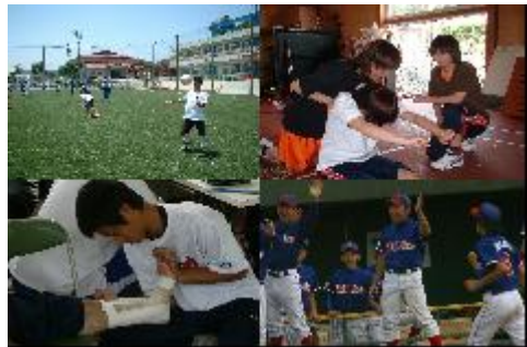
（スポーツを中心とした教育課程）