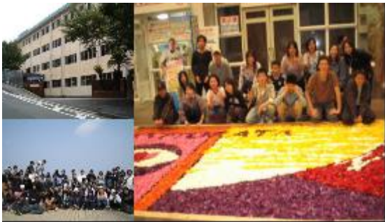
（校舎、校外活動風景）