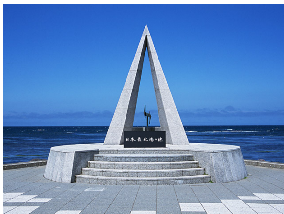
(日本最北端の地の碑)