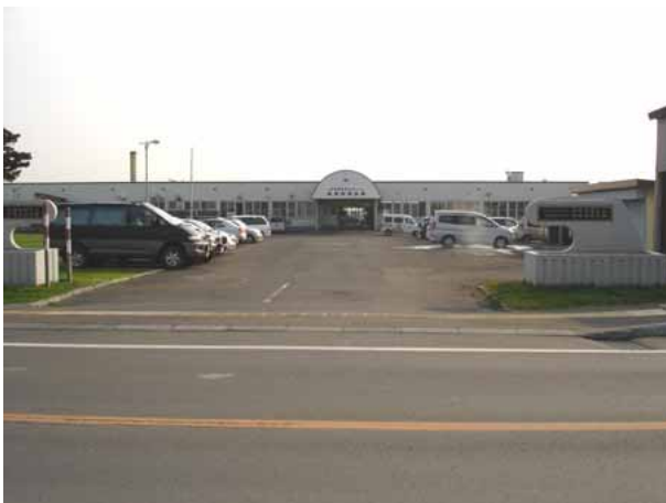
《福祉有償輸送利用施設》

適用される規制の特例措置： ・ N P O ボランティア輸送によるセダン車の使用