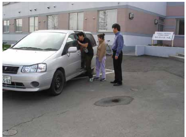
《施設職員による通院援助》