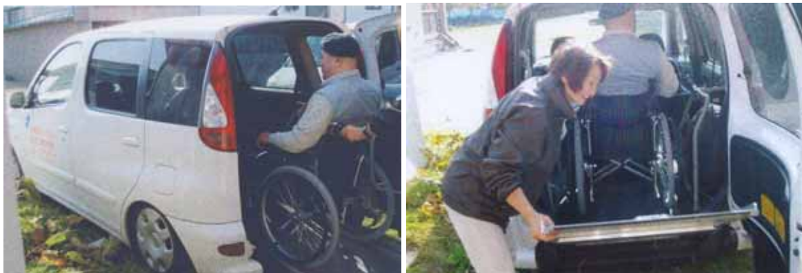
《訪問介護員による外出介助》