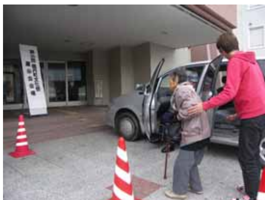
〔催しへの参加、見学等の支援〕