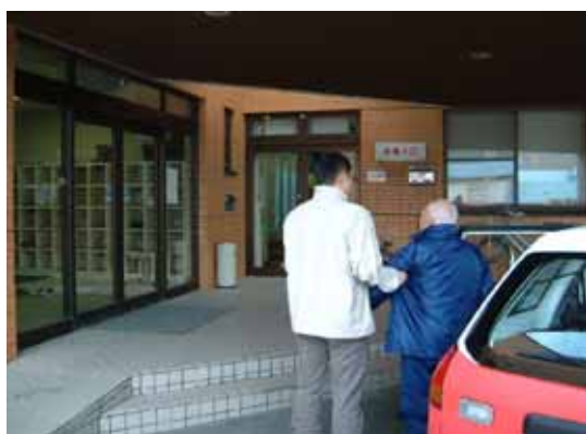
〔ホームヘルパーによる通院の援助〕