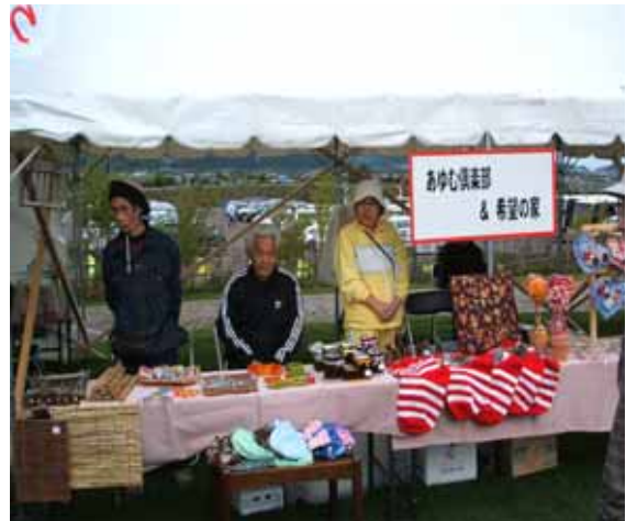
「町内行事への出店参加」