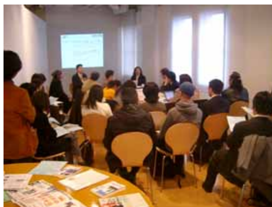
クリエイティブBizヨコハマフォーラム