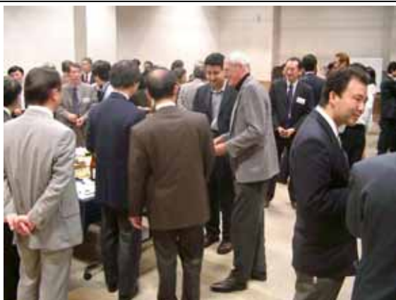
新横浜ITクラスター交流会