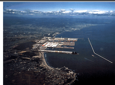
常陸那珂港（将来イメージ）