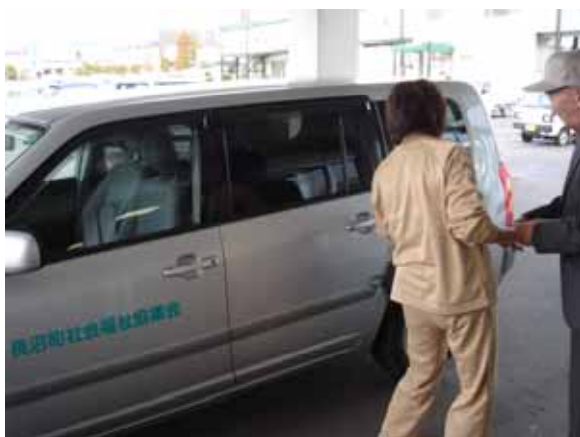
「視覚障害者への通院援助」