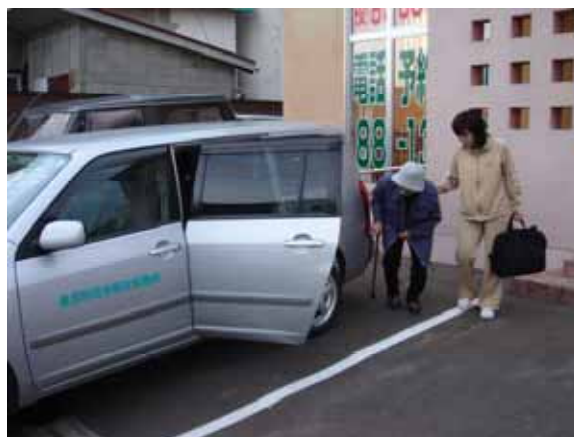
「介護認定者への通院援助」