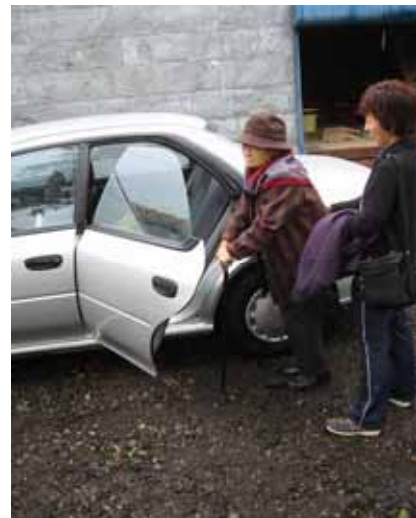
(訪問介護員による乗降介助)