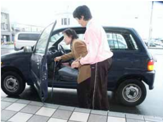
(訪問介護員による通院乗降介助)

適用される規制の特例措置： ・ N P O ボランティア輸送によるセダン車の使用