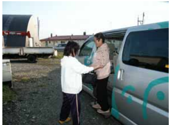
(人工透析患者の通院乗降介助)