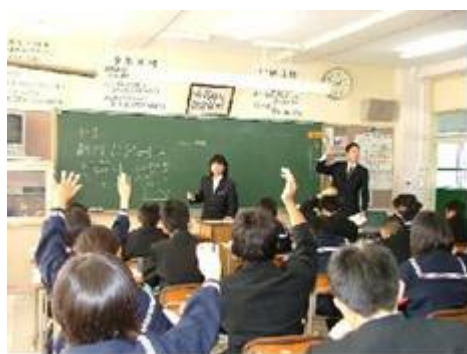
中学校 T T 指導