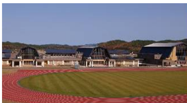
統合小学校（東通小学校）