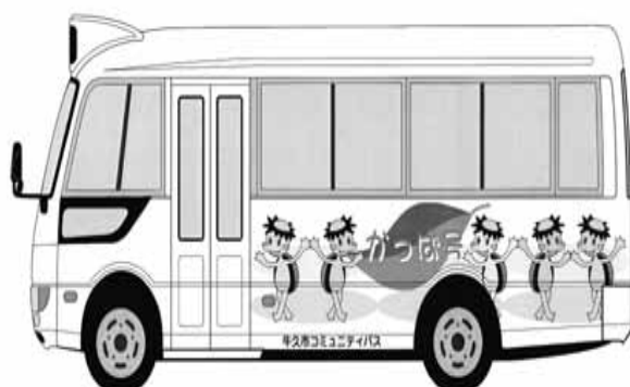
コミュニティバスかつぱ号