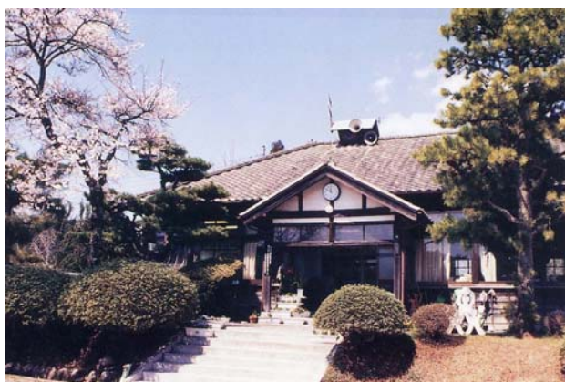
活用を予定する旧浅川小学校学校