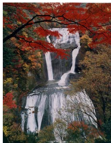
自然豊かな大子町（袋田の滝）