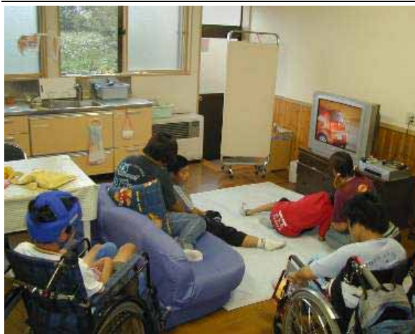
(学童保育等、くつろぎの場面)