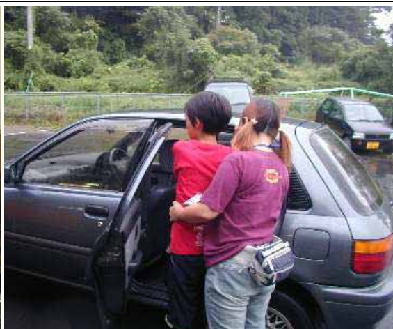
(ヘルパーによる乗降介助)