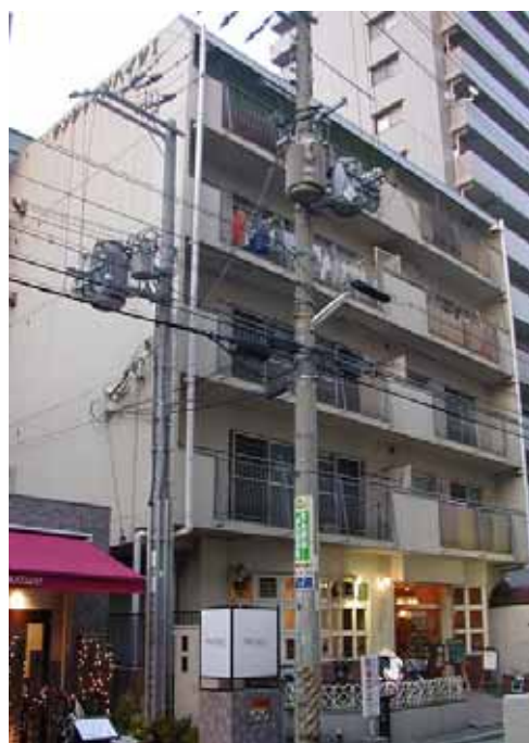
「都市部における集合住宅を活用したグループホーム」