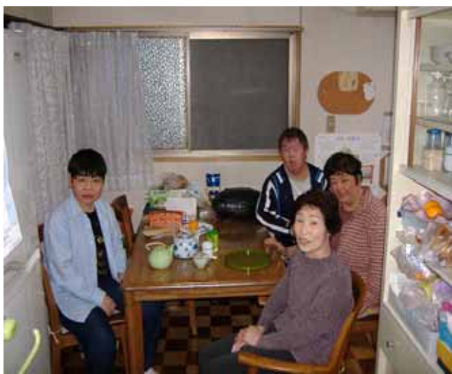
「リビングで団楽する入居者と世話人」